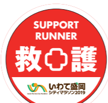
救護サポートランナー用ステッカー

今大会では、より安全・安心な大会運営を目指し、大会に参加される医療従事者、約430名の皆様に、「救護サポートランナー」のご登録をいただいております。ご登録者にはステッカーを大会当日、胸等目立つ場所に貼ってご参加ください。 (1)心肺停止等、緊急性を要する場合には、救命処置にあたってください。 (2)ケガや体調不良の選手を発見した場合には、選手に声を掛け、状態を確認し、最寄りの競技役員(走路員)・救護スタッフと連携し必要な処置を行ってください。