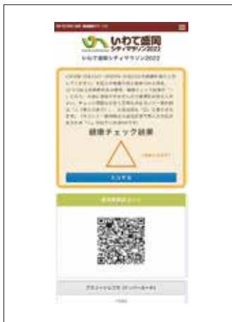
※画像はスマートフォンの画面イメージ