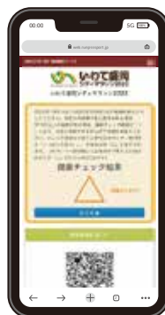
スマートフォン画面

健康チェック時に結果がわかるもの(右記二つのうちどちらか)と二次元バーコードをご提示ください。 スマートフォンで結果画面を提示する場合は、結果確認後、画面をスクロールして二次元バーコードを表示します。