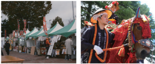
昨年のマラソンフェスティバルの様子